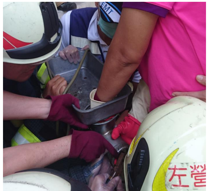
圖.1、2 勞工手指遭絞肉機捲入，救護人員緊急搶救。